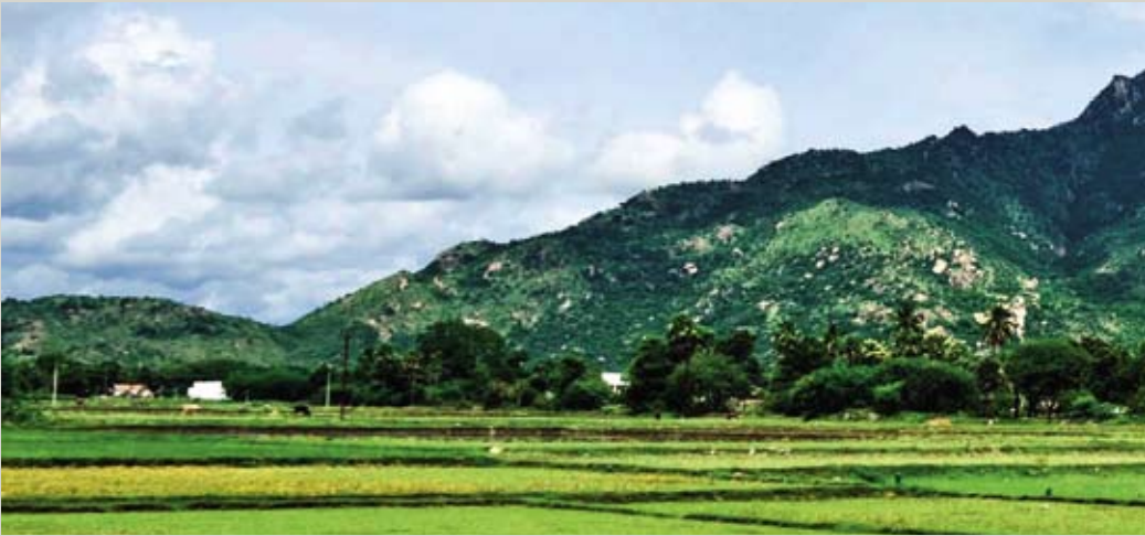
Oben: Arunachala von der Perumpakkam Road aus, Südansicht